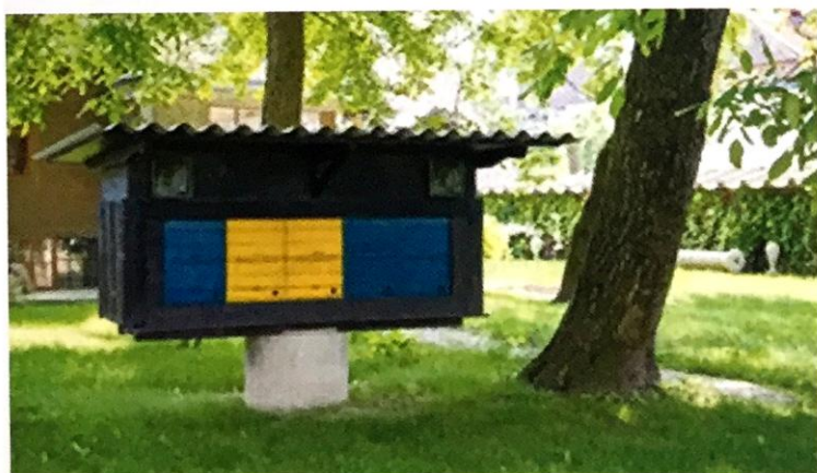
Obr. 2: Plečnikův včelín na zahradě u jeho domu v Lublani-Trnovu.