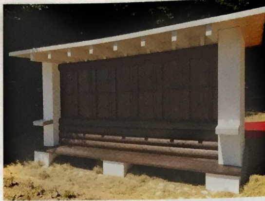
Obr. 4: Replika Plečnikova včelína v Lublani den před slavnostním otevřením 1. 7. 2021.

Jože Plečnik, původem z Lublaně, po sobě zanechal bohaté architektonické dílo ve Vídni, v Praze a nejvýznamněji právě ve svém rodišti, jehož podobu výrazně proměnil. V červenci letošního roku byla Plečnikova vybraná díla v Lublani zařazena na seznam světového dědictví UNESCO. Slovincina navíc letos prosadilo do seznamu nehmotného