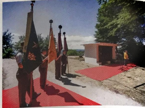
Obr. 5: Zástavy včelařských spolků před včelínem při slavnostním odhalení repliky 2. 7. 2021. V pozadí za včelínem vidět Lublaň.