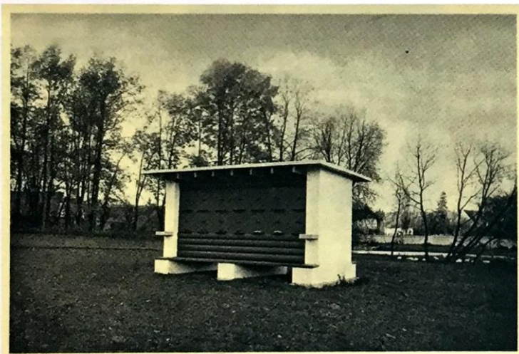
Obr. 1: Fotografie včelína v knize Architectura perennis, 1941.