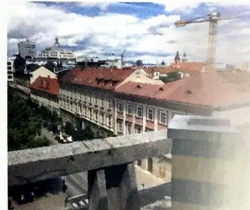
Obr. 8: Pohled ze střechy Gymnázia Jože Plečnika v Lublaně, kde studenti chovají včely.